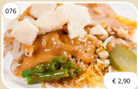
Groenten met satésaus Vegetables with satay sauce (LV,V)