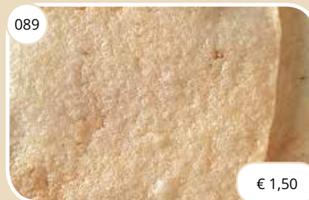
Kroepoek Prawn crackers (LV)