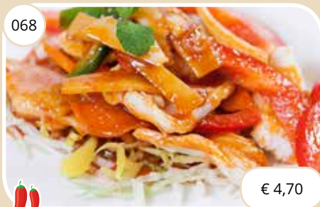
Kipfilet in chilisaus Chicken in chili sauce (GV,LV)