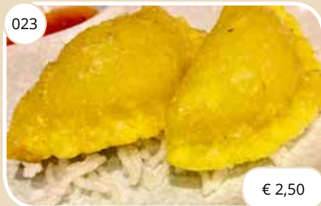
Krokante vleespasteitjes Crispy meat dumplings (LV)