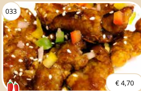
Krokant vlees met zuur-pittige saus Crispy meat with sour sharp sauce (LV)