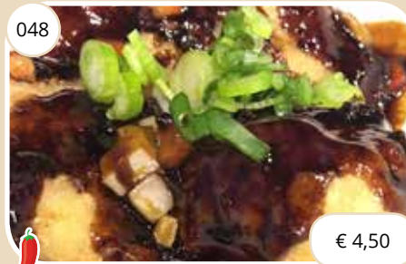
Visfilet in zoet-pittige saus Fish filet with sweet sharp sauce (LV)