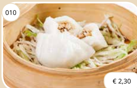
Vleespasteitjes Pork dumplings (LV)