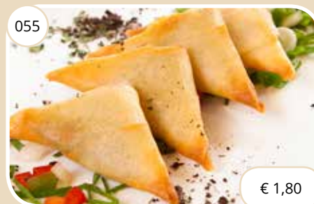
Driehoekige flensjes met kerry Triangular pancakes with curry (LV)