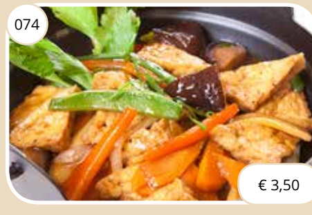
Tofu met oestersaus Tofu with oyster sauce (GV,LV,V)