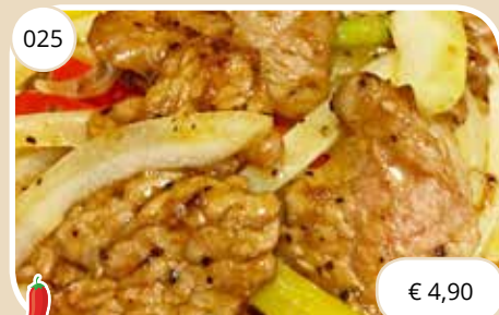
Ossenhaas met zwarte pepers Beef with black peppers (GV, LV)