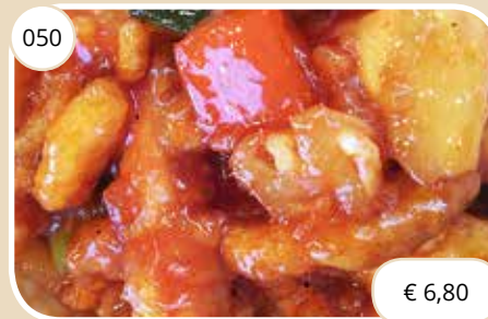
Po met kip in zoet-zure saus Hot pan chicken with sweet sour sauce (GV, LV) max. 1 p.p.p.r