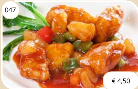
Visfilet met zoet-zure saus Fishfilet with sweet sour sauce (GV, LV)