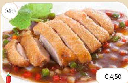
Eend met zuur-pittige saus Duck with sour sharp sauce (LV)