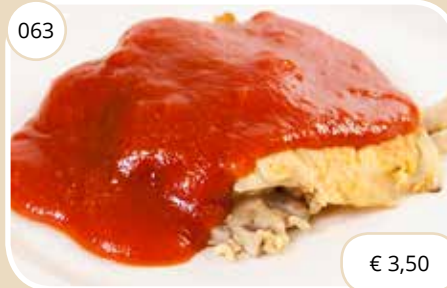
Foe Yon Hai met vlees Eggs with meat (LV,KV)