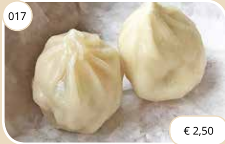
Shanghaise vleespasteitjes Shanghaiese meat dumplings (LV)