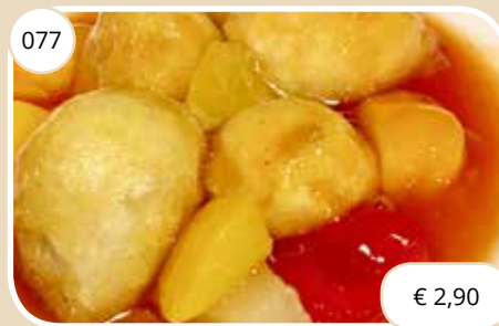
Gebakken waterkastanjes Fried water chestnuts (LV,V)