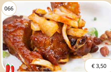
Ribjes met chilisaus Ribbs with chili sauce (GV,LV)