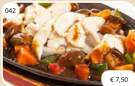
Kippenvlees Chicken meat max. 1 p.p.p.r