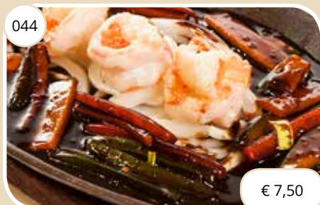
Garnalen Shrimp max. 1 p.p.p.r