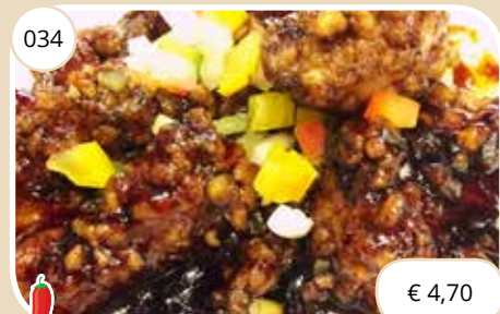
Krokante kip met zoet-pittige saus Crispy chicken with sweet sharp sauce (LV)