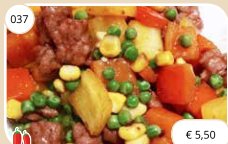
Ossenhaas op Kantonese wijze Cantonese style tenderloin (GV, LV)