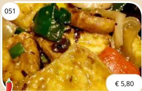
Po met tofu in zwarte bonensaus Hot pan tofu with black bean sauce (LV) max. 1 p.p.p.r