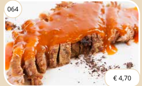
Babi Pangang Crispy meat (LV)