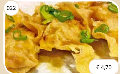
Krokante vlees/garnalen flensjes Crispy meat/schrimp dumplings (LV)