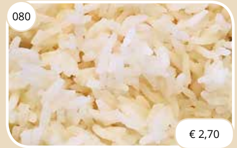
Witte rijst Steamed rice (GV, LV, V)