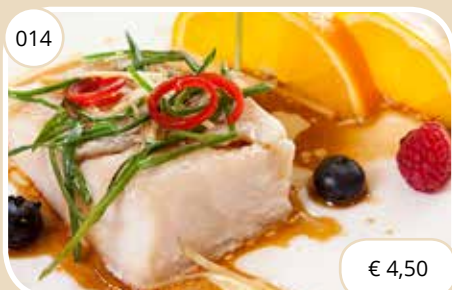
Gepocheerde vis op Kantonese wijze Cantonese style poached fish (LV)