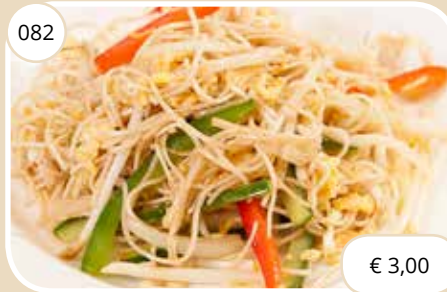
Chinese bami Chinese noodles (LV, V)