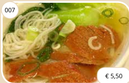
Mihoen soep met Cha Siew Rice noodles soup with meat (GV,LV)