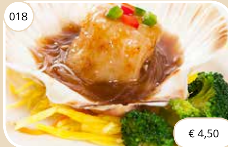
Gestoomde Sint Jacobsschelp Steamed scallop (GV, LV) max. 1 p.p.p.r