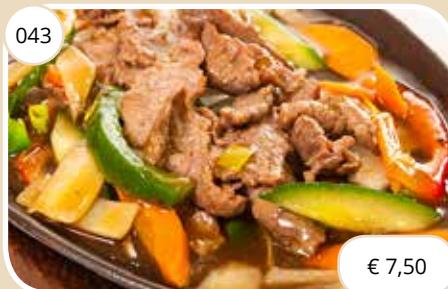
Ossenhaas Filet beef max. 1 p.p.p.r