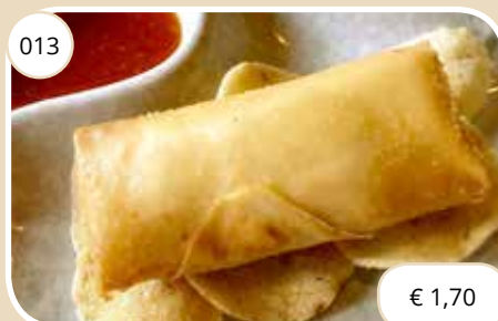
Chinese loempia gevuld met zoet vlees Springroll with sweet meat (LV)