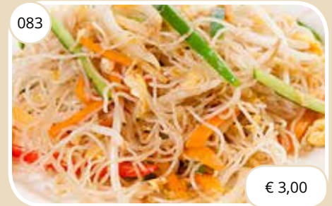
Mihoen Rice noodles (GV, LV, V)