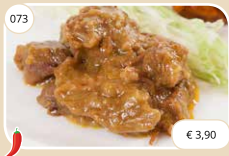
Rundstoofvlees met kerrysaus Beef stewed with curry sauce (LV)