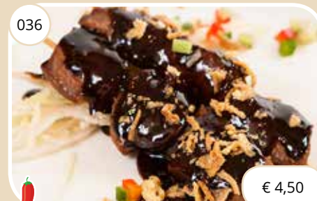
Lamssaté Lamb satay (LV)