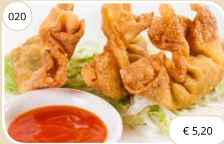
Krokante flensjes met garnalen Crispy shrimp dumplings (LV)