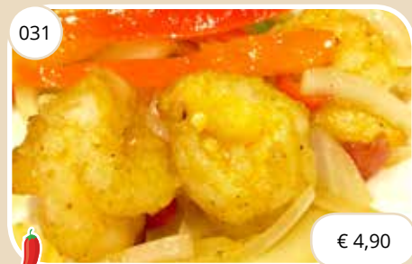
Garnalen met knoflook en pepers Shrimp with garlic and peppers (GV, LV)