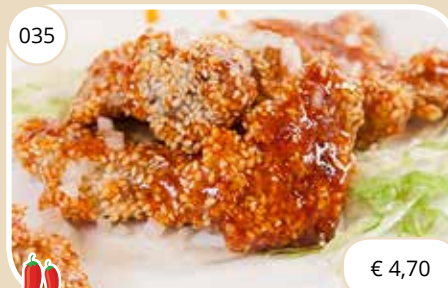
Chili kip met sesamzaadjes Chili chicken with sesam seeds (GV, LV)