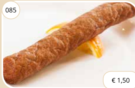
Frikandel Frikandel (LV)