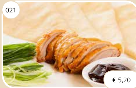
Pekingeed-rollen met salade Duck rolls with salad (LV)