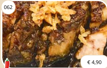
Vlees met scherpe ketjapsaus Pork meat with sweet sharp sauce (LV)