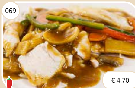
Kipfilet in kerrysaus Chicken in curry sauce (LV)