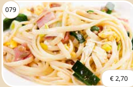
Gebakken bami Fried noodles (LV, KV)