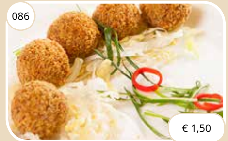
Bitterballen Croquette balls (LV)