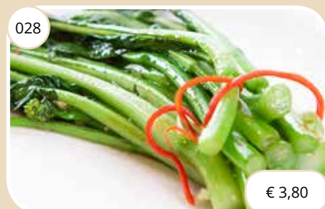
Groenten van de dag Vegetables off the day (GV, V, LV)