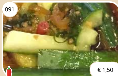
Pittige komkommers Sharp cucumber (LV,V)