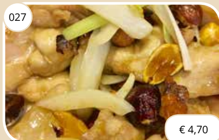
Kipstukjes met notenmix Chicken with nuts (GV, LV)