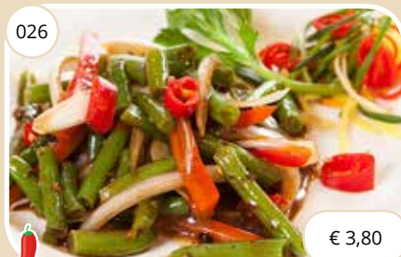
Boontjes op Taiwanese wijze Taiwan style beans (GV, V, LV)