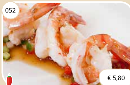
Po met garnalen in een pittige saus Hot pan shrimp with a sharp sauce (LV) max. 1 p.p.p.r