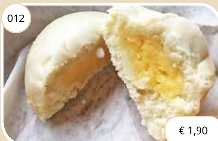
Broodje gevuld met zoete pudding Bread filled with sweet custard (V)