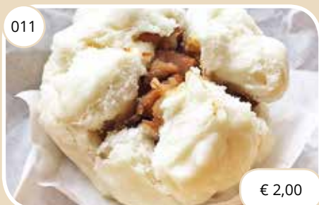
Broodje gevuld met zoet vlees Bread filled with sweet pork (LV)