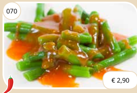
Boontjes met sambalsaus Beans with sambal sauce (LV,V)