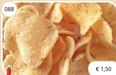
Pittige kroepoek Spicy crackers (LV)