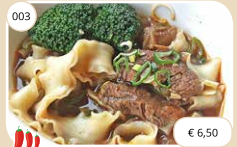
Bamisoep met bief op Taiwanese wijze Taiwan style noodle soup with beef (LV)