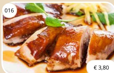
Zoete maggie kip Sweet maggie chicken (LV)