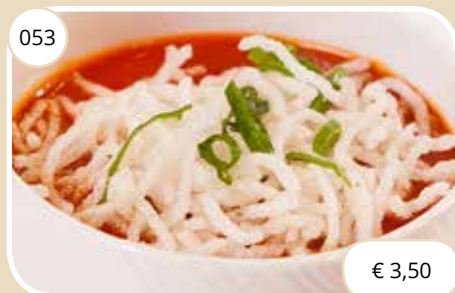
Tomatensoep Tomato soup (LV)