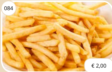
Friet French fries (LV, V)