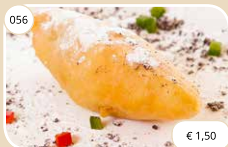
Gebakken banaan Fried banana (LV, V)