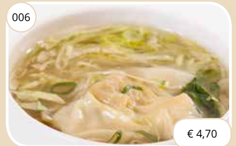
Soep met vlees flensjes Soup with meat dumplings (LV)