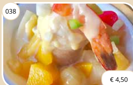
Vis en garnalenrol Fish and shrimp roll (GV)