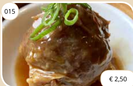
Gestoomde runderbol Steamed beef ball (LV)