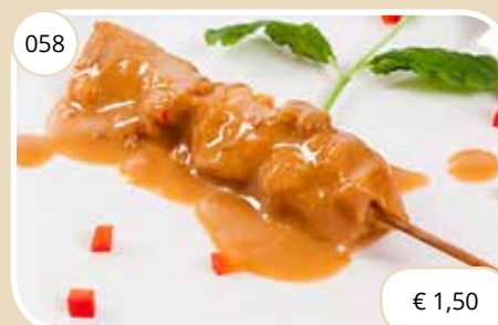
Kipsaté Chicken satay (LV)