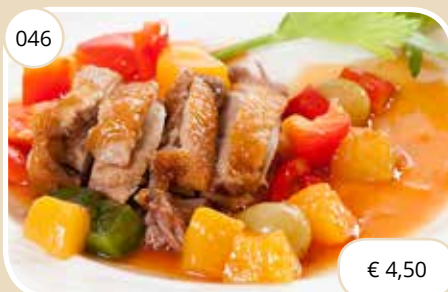
Eend met zoet-zure saus Duck with sweet-sour sauce (GV, LV)