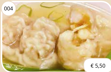
Soep met garnalen flensjes Soup with shrimp dumplings (LV)