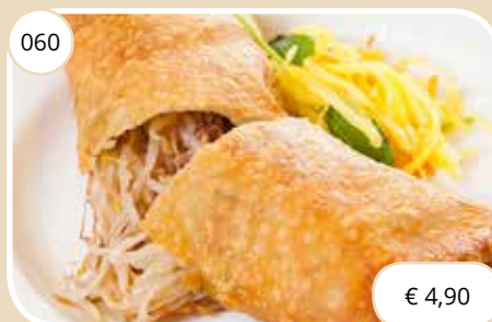
Loempia Springroll (LV) na 16:00 uur + € 1,50 extra