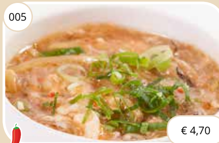
Zuur-pittige soep met vlees en tofu Sour-sharp soup with meat, tofu (GV,LV,KV)