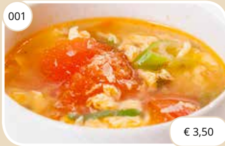
Tomatensoep op Kantonese wijze Cantonese style tomato soup (GV,LV,KV)