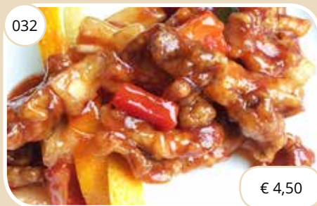
Krokante zoet-zure spekreepjes Sweet and sour crispy bacon (GV, LV)