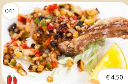
Lamskotelet op Szechuan wijze Szechuan style lamb chops (GV, LV)