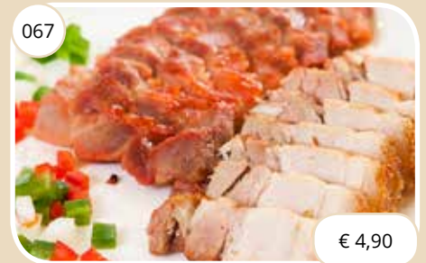
Vlees mix Meat mix (GV,LV)