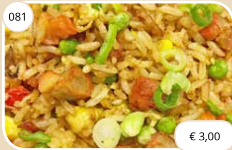
Kantonese gebakken rijst Cantonese style fried rice (GV, LV, KV)