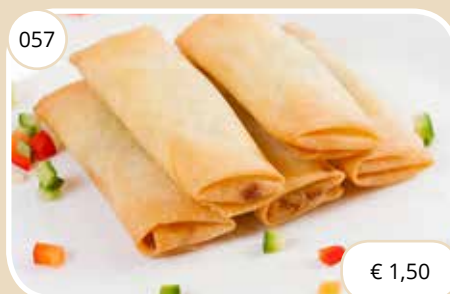
Mini loempia's Mini spring rolls (LV, V)