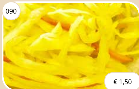
Zure wittekool Sour cabbage (GV,LV,V)