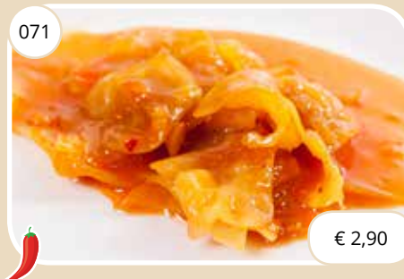
Kool met sambalsaus Cabbage with sambal sauce (LV,V)