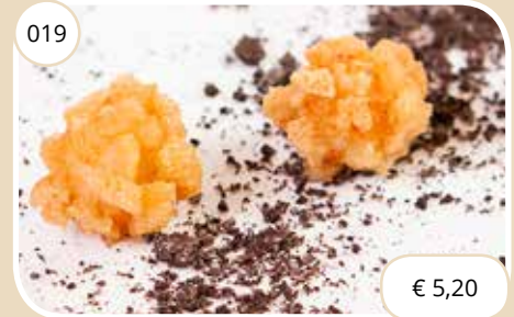
Krokante garnalen bol Crispy shrimp ball (LV)