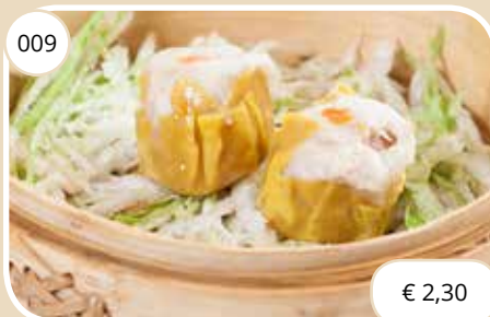
Vlees/garnalenpasteitjes Meat/shrimp dumplings (LV)