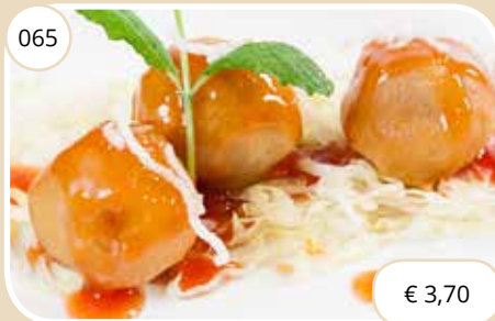
Krokante vleesballetjes Crispy meatballs (LV)