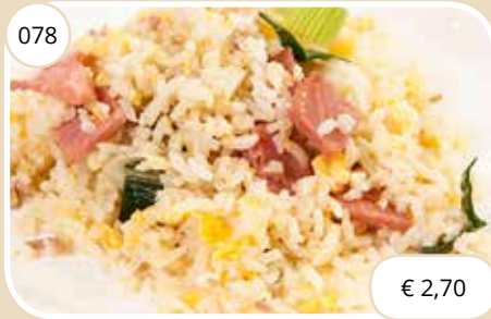
Gebakken rijst Fried rice (GV, LV, KV)