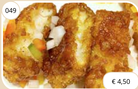
Krokante vis met kruiden Crispy fish with spices (LV)