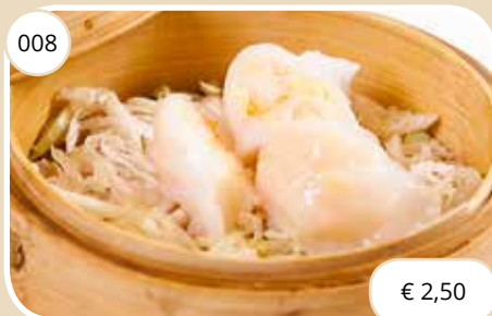
Garnalenpasteitjes Shrimp dumplings (GV, LV)