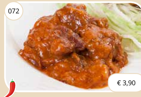
Rundstoof vlees in rode pepersaus Beef stewed with red pepper sauce (LV)