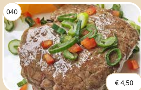
Gegrild biefstukje Grilled steak (GV, LV)