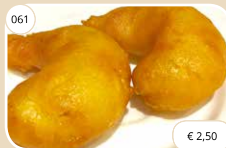
Gepaneerde garnalen Fried shrimp (LV)