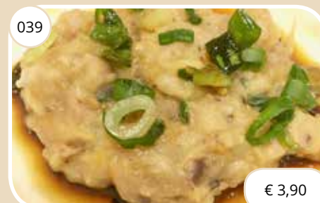
Varkensvlees op Kantonese wijze Pork on Cantonese style (LV)