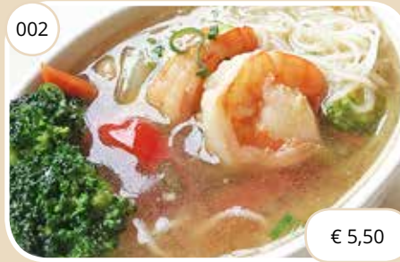
Mihoensoep met garnalen Rice noodle soup with shrimp (GV,LV)