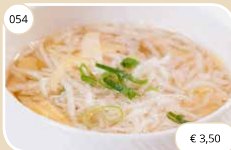
Kippensoep Chicken soup (GV, LV)