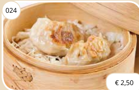
Half rond vormige kippasteitjes Half round shaped chicken dumplings (LV)