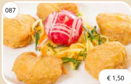
Kipnuggets Chicken nuggets (LV)